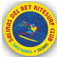
Salinas Del Rey Kite Club